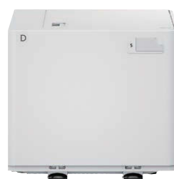
MAGASIN D'IMPRESSION À LA DEMANDE LITE C1