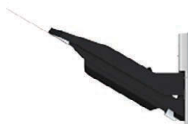
BAC À DÉCALAGE-F1