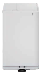
MAGASIN PAPIER LATÉRAL E1