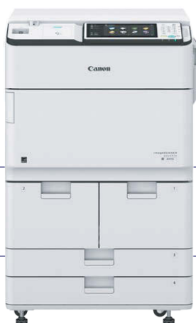
IR ADV 6555i PRT