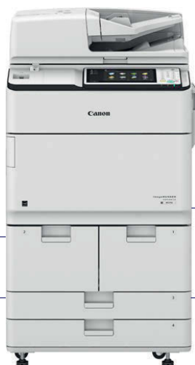
IR ADV 6575i/6565i/6555i